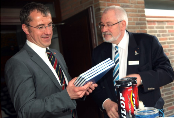
Otto Lukat (Bürgermeister der Stadt Uelzen)